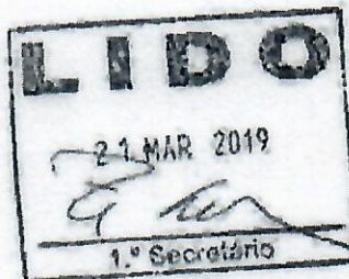
RENATO CÂMARA Deputado Estadual-MDB